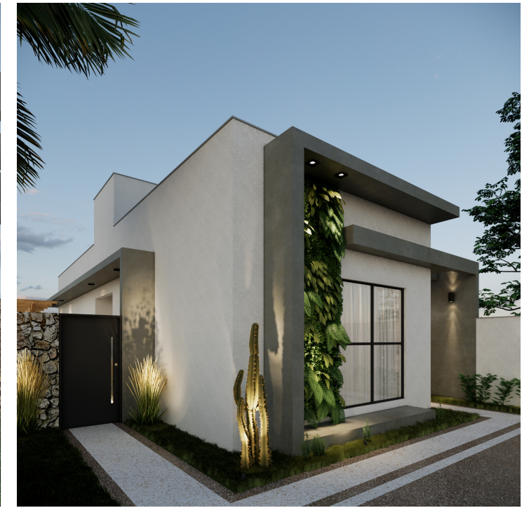
TABELA DE ACABAMENTOS